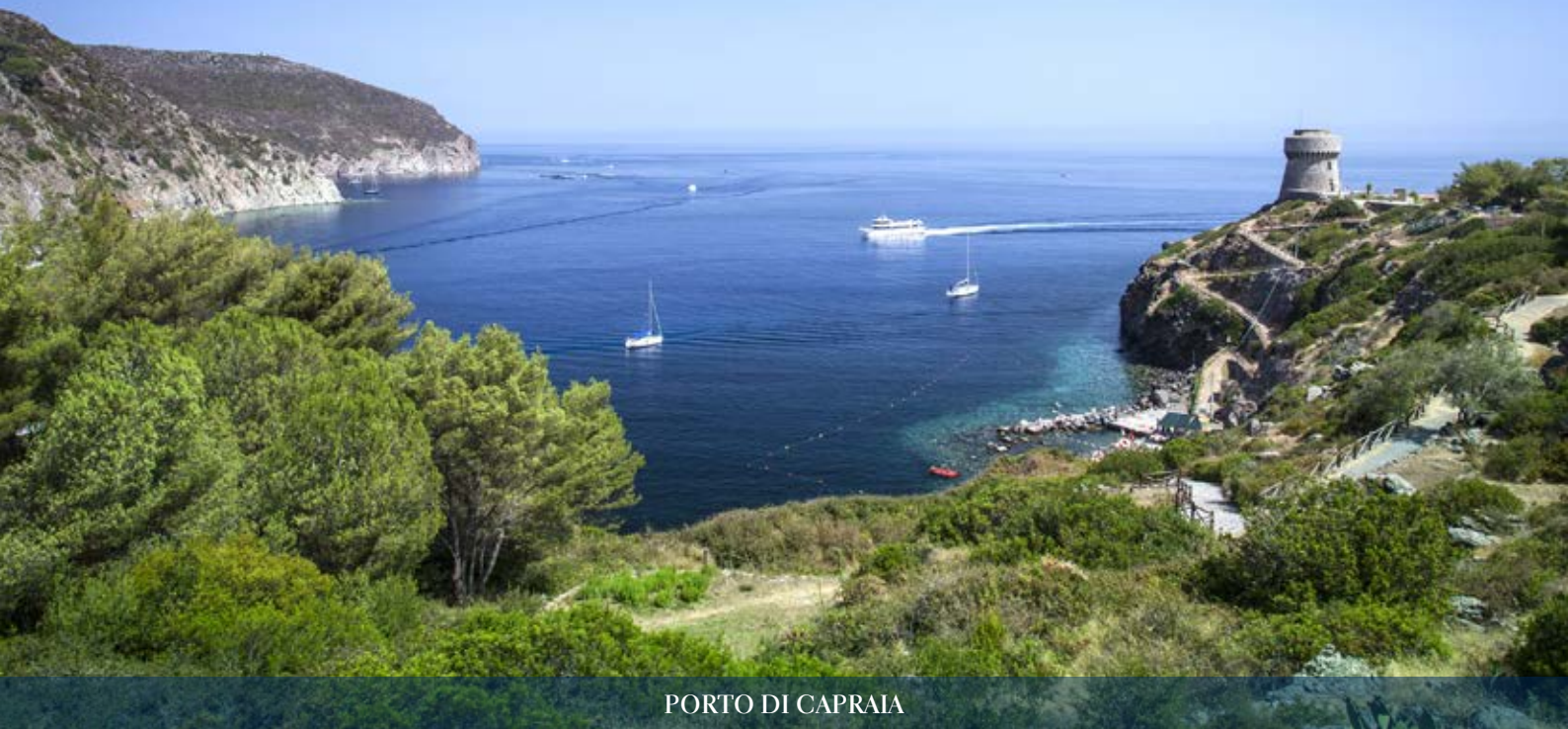
PORTO DI CAPRAIA